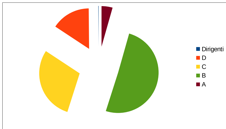
Risorse umane con contratto a tempo indeterminato