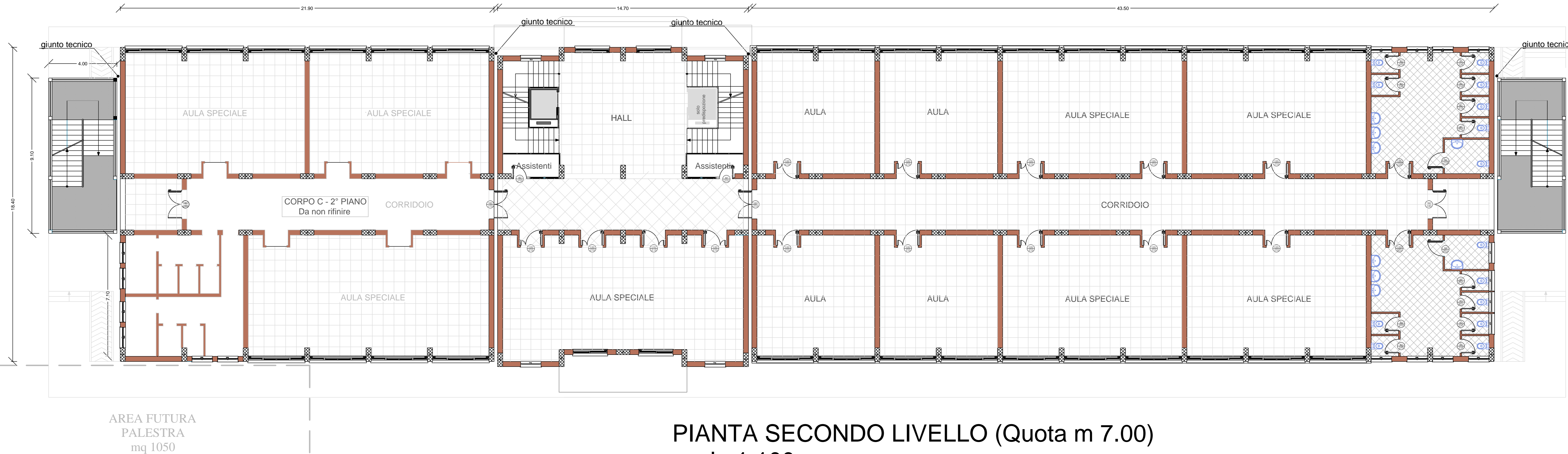
PIANTA SECONDO LIVELLO (Quota m 7.00) scala 1:100