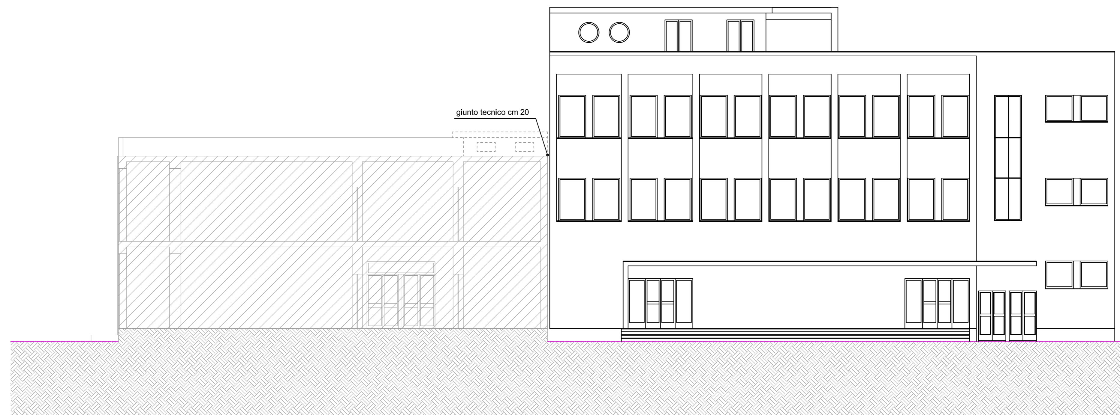
SEZIONE E PROSPETTO SU CORTILE INTERNO