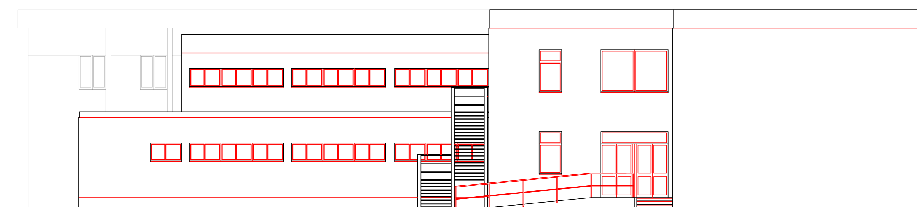
PROSPETTO SU CORTILE INTERNO LATO S