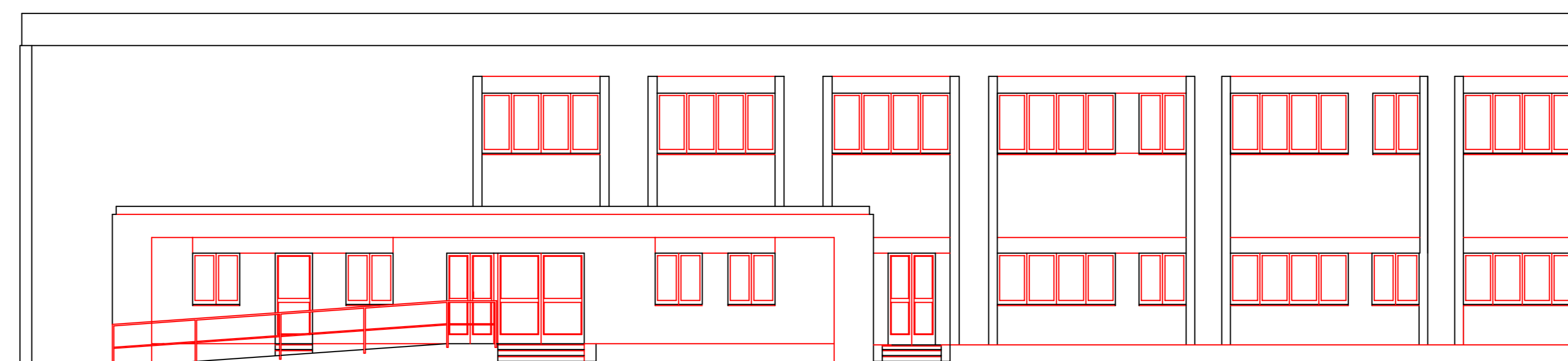
PROSPETTO SU VIA TORRENTE SANTA LUCIA