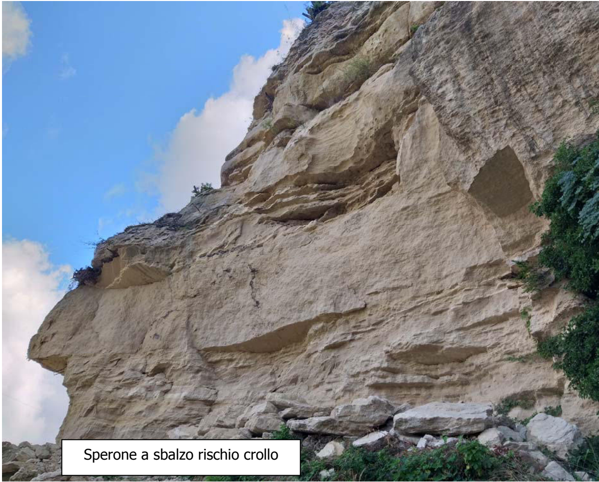
Sperone a sbalzo rischio crollo