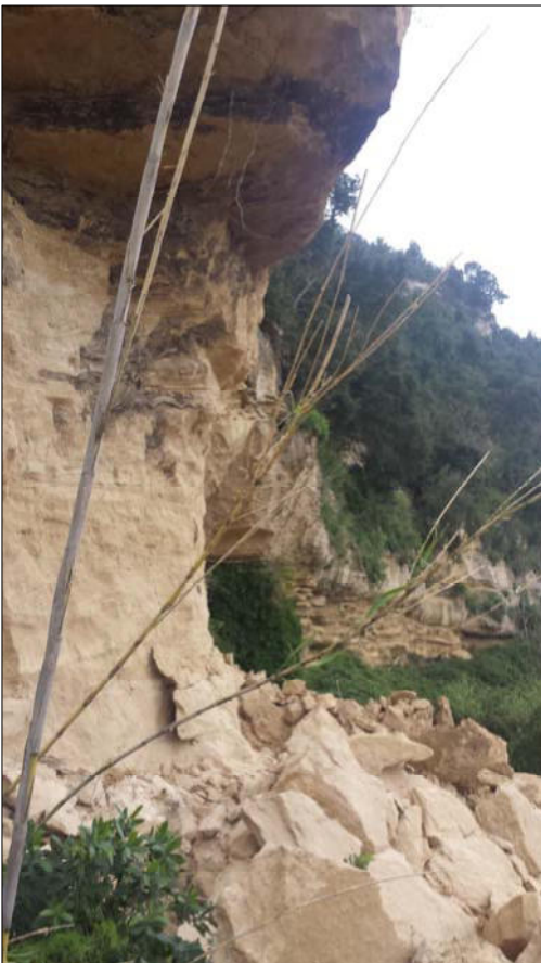
foto a sinistra e in basso: Particolare zona di distacco e accumulo sulla SP 54 (2015)