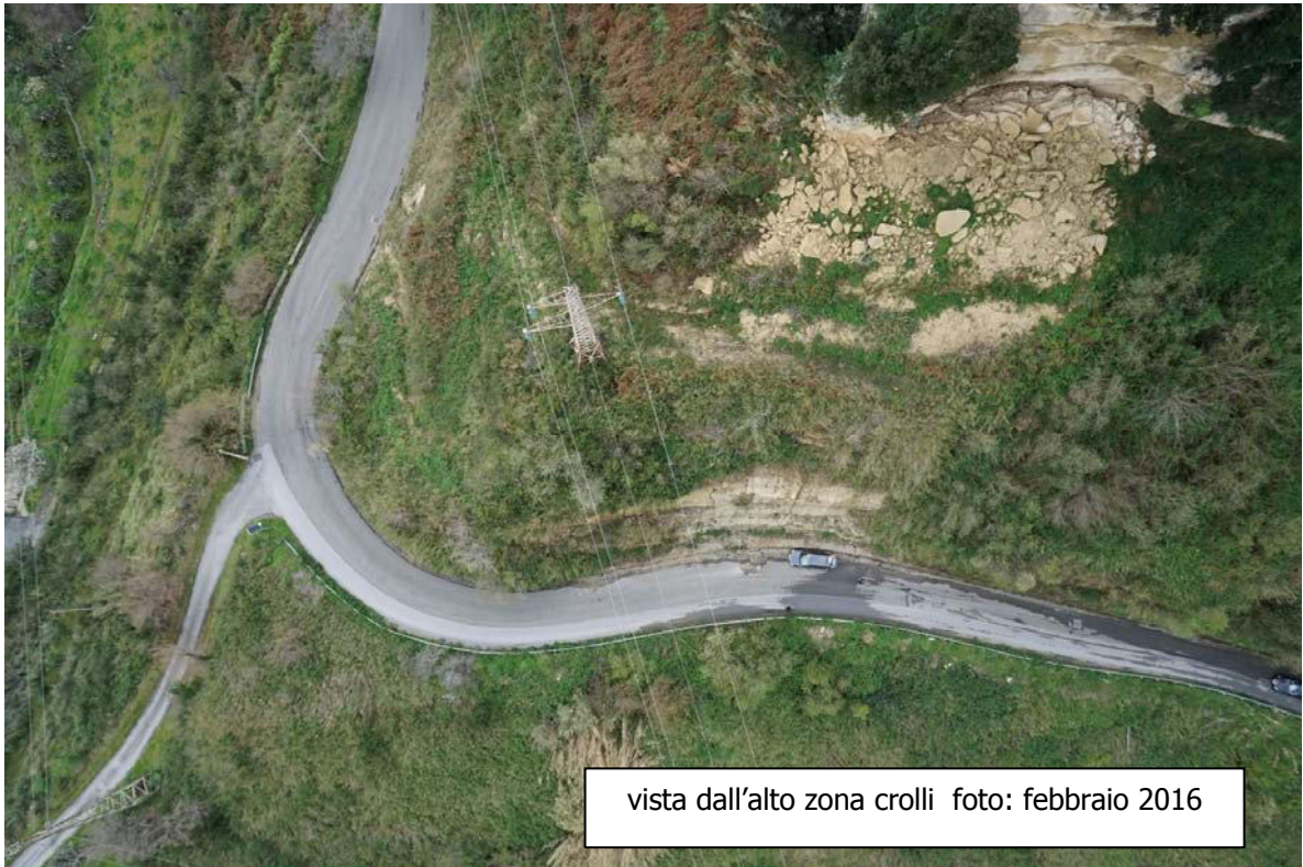
vista dall'alto zona crolli foto: febbraio 2016