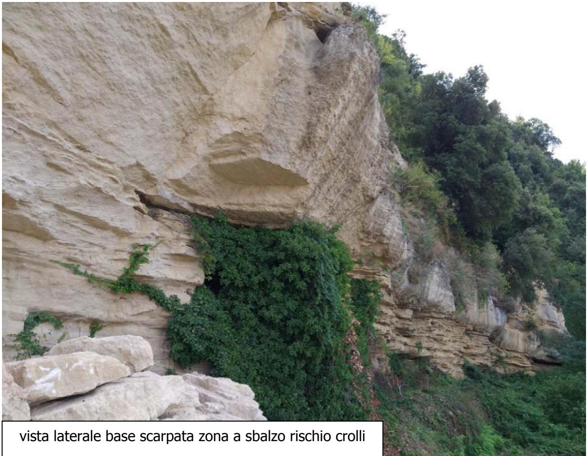
vista laterale base scarpata zona a sbalzo rischio crolli