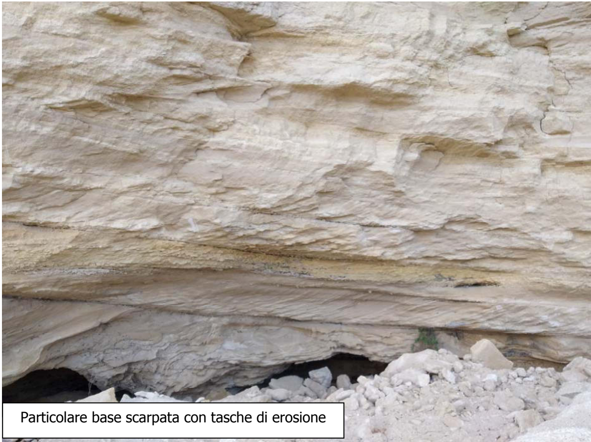
Particolare base scarpata con tasche di erosione