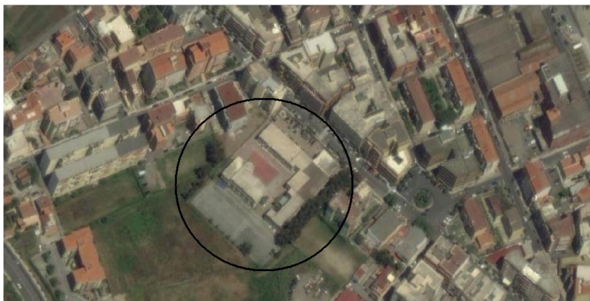
Figura 1_ I.T.C.G. "Leonardo da Vinci" di Milazzo (ME)

Nelle sue immediate vicinanze sono ubicati tutti i vari luoghi di partenza ed arrivo da tutte le destinazioni, e comunque serviti da mezzi pubblici.